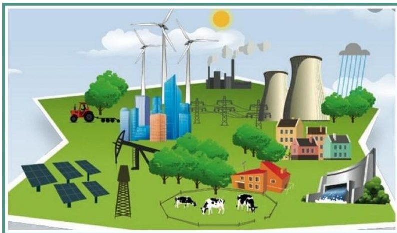
Les options de la transition énergétique

Un groupe d'élus de la commune de Nargis s'est réuni le 9 octobre dernier pour se positionner par rapport aux différents types d'ENR et faire état des lieux où ces ENR sont souhaitables. Nous avons suivi la procédure de diffusion indiquée dans le guide de planification des ENR, à savoir d'abord l'envoi de ce compte rendu de travail au Conseil municipal (fait) puis l'envoi du compte rendu ce jour à la population au sein de ce L.I.E.N, (c'est ce que nous faisons là) ; la prochaine étape sera la délibération du Conseil municipal le 8 décembre et enfin l'envoi à la CC4V en direction du référent préfectoral unique. Vous verrez dans ce compte rendu que notre position opposante à l'éolien n'a pas changé et que nous donnons également notre avis sur les 3 autres opérations majeures de photovoltaïque en cours d'élaboration.